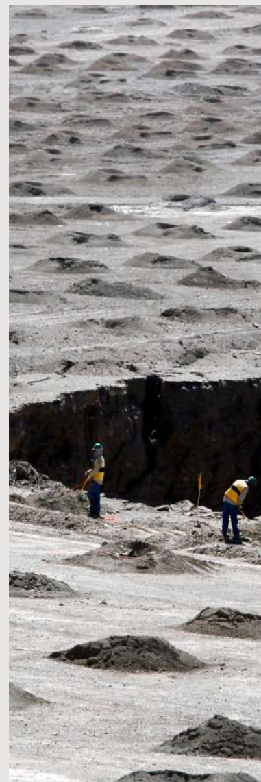
Operarios trabajan en el prestripping de una zona de la mina de cobre a rajo abierto de Ministro Hales.

b) Ley Orgánica Constitucional sobre Concesiones Mineras (Ley Nº 18.097). La Constitución encargó a la ley determinar lo que, para muchos, constituyen los aspectos más relevantes de las concesiones mineras: duración, extinción, derechos y obligaciones emanadas de las concesiones. En efecto, se puede señalar que "la ley Orgánica se propone asegurar la convivencia colectiva y el crecimiento de la actividad, configurando para ello un régimen de concesiones mineras que cautele tanto los intereses del Estado como los del concesionario" 8 . Sin ir más lejos, el propio Informe Técnico del