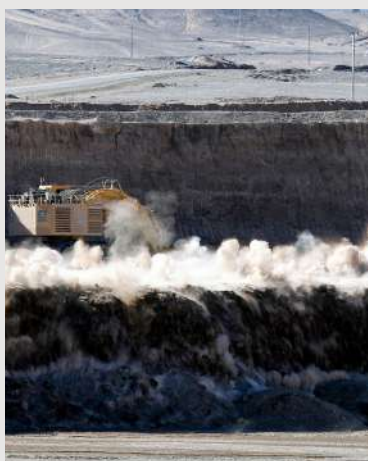
Voladura en el prestripping de una zona de la mina de cobre a rajo abierto de Ministro Hales.

c. Justa indemnización en caso de expropiación de la concesión minera. Habiendo reconocido y fortalecido especialmente el derecho de propiedad respecto de la concesión minera, que el Estado indemnice al concesionario en caso de expropiación es una consecuencia lógica y necesaria. ¿Por qué es de toda justicia esta indemnización? Atendido el carácter azaroso de la minería, y las grandes sumas de capital que se invierten sin que rindan los frutos deseados, que el Estado pudiera expropiar los yacimientos valiosos sin considerar las perspectivas económicas que importaban para el concesionario