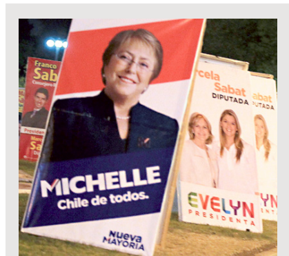
Campaña presidencial 2013.